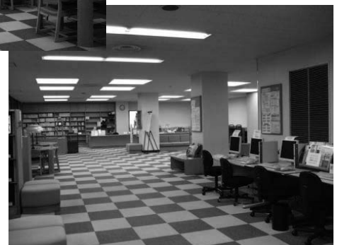
閲覧コーナーからカウンターを望む