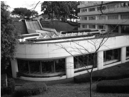
4号館1階の沼津図書館外観

2010年度より開発工学部は、学生募集を停止し、2014年度より大学院開発工学研究科修士課程が、学生募集を停止し、2015年3月に、最後の開発工学研究科修士課程の学生が全員修了し、沼津図書館もその任を終えました。その間、沼津図書館閉館に向けて、図書資料、用品備品の他図書館での利活用・移管等処理に関しましては、中央図書館を始めとする各校舎の図書館の皆様に変な世話になりました。ここに厚く御礼申し上げます。